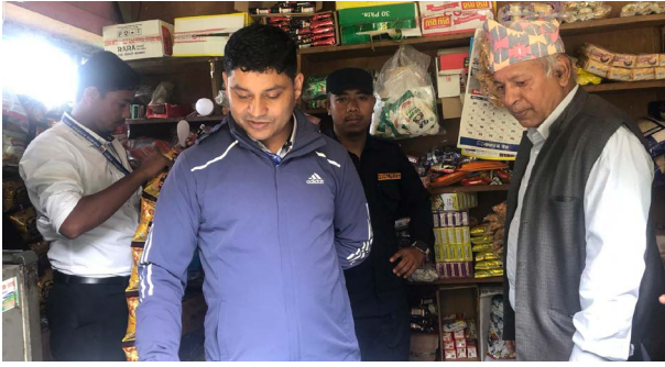
जननिगरानी संवाददाता काठेखोला

दिन पहिले मात्र विक्री गरेको पाइएको उहाँले बताउनुभयो ।