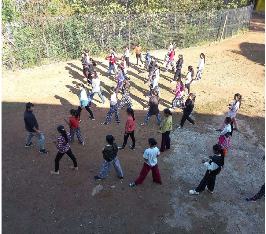
काठेखोला गाउँपालिका-२, भीमापोखराको जनकल्याण माध्यमिक विद्यालयका कक्षा ८, ९, १० र ११ का छात्रा विद्यार्थीहरू आत्मसुरक्षा तालिम लिँदै । भीमापोखरा खेलकुद विकास समितिको आयोजनामा उक्त तालिम संचालन गरिएको हो ।

पन्ध्र वर्ष अघि सम्म ७०/८० वटा भैंसी हुने आरकोट चौरमा अहिले मुस्किलले १०/१२ वटा भैंसी देख्न पाइन्छ । धर्म संस्कृतिसंग जोडिएको पोखरी र चौतारा बसाइँसराइ तथा आधुनिकताले ओझेलिएको हो । पहिले-पहिले स्थानीयले पोखरी निर्माण गर्दा र चौतारी बनाउँदा पुन्य कमाइने मान्यता रहे पनि अहिले कसैले पनि यस्ता काम नगर्ने खत्रीको भनाई छ । बुढापाकाले काम गर्न नसक्ने र युवा पुस्ताले यस्ता धार्मिक काम गर्न तर्फ चासो नदिँदा पोखरी र चौतारी