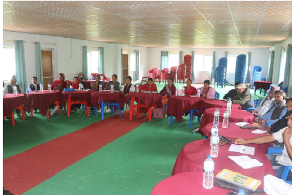
अति अधिकारका कुरा उठाइन्छ। विकले जन्नुभयो, 'सबैलाई समान व्यवहार अर्कै छैन' ।

देशमा व्यवस्था परिवर्तन भएपनि पछि परेको समुदायले अझै अधिकार प्राप्त गर्न नसकेको सरोकारवालाले बताएका छन् । देशको राजनीतिक परिवर्तनमा योगदान गरेका दलित समुदायको अहिले पनि अवस्थामा उल्लेख्य सुधार आउन नसकेको काठेखोला गाउँपालिकाले आयोजना गरेको जातिय विभेद एवम् छुवाछुत उन्मूलन सम्बन्धि कार्यक्रमका सहभागीले बताएका छन् ।