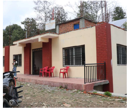
काठेखोला गाउँपालिका वडा नम्बर ५ को वडा भवन।

विहूपोखरामा निर्माण भएको प्रशासनिक भवनले छानो कुरिरहेको छ। वडा कार्यालय आफ्नै बलबुतामा तीन वर्षअघि निर्माण थालेको भवनबाट सबै प्रशासनिक काम त हुन्छ तर भवन पुरा भएको छैन। भवनको पहिलो तल पुरा भए पनि दोस्रो तला पुरा भएको छैनन्। भवनमा छानो अभाव देखिएको छ। "शामिले बजेटका लागि कयौँ ठाउँमा गुहार माग्दा कहँबाट