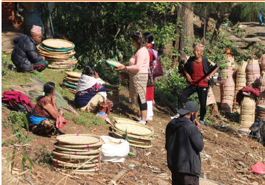
चैते दशैको अवसरमा बागलुङ बजारमा आयोजित चैत्राष्टमी मेलाका वित्रीको लागि ल्याइएको नाङ्लो वित्री गदै व्यवसायीहरू । चैत्राष्टमीमा गाउँ-गाउँबाट धेरै उत्पादनहरू वित्रीको लागि बागलुङ बजार ल्याइने गरिन्छ ।