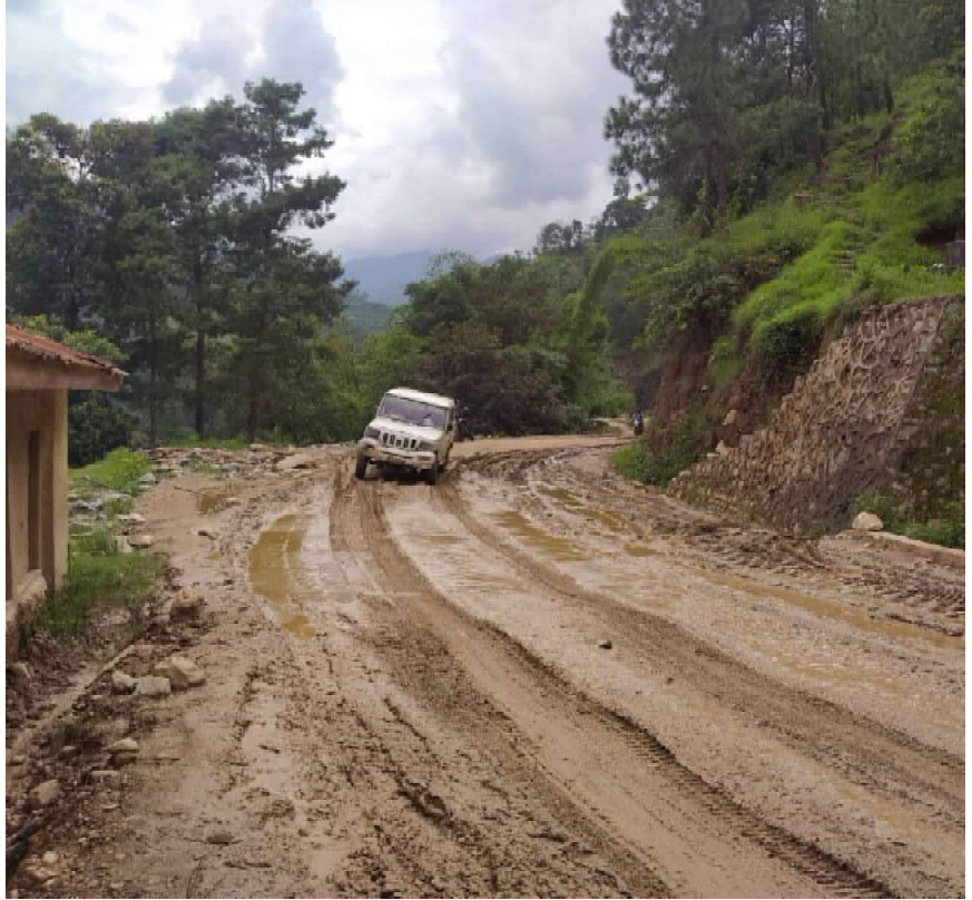
मध्यपहाडी लोकमार्ग बागलुङ-अक्षेते खण्ड अन्तरगत काठेखोला गाउँपालिका-१ सडकको हिलाम्ने सडक। सडक हिलाम्ने हुँदा लोकमार्गलागयात अन्य ग्रामीण सडकमा सर्वसाधारण कष्टकर यात्रा गर्न बाध्य भएका छन्।