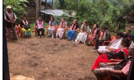
जननिगरानी संवाददाता बागलुङ

काठेखोला गाउँपालिका वडा नम्बर २ भीमापोखरामा बाढी पहिरोबाट क्षतिग्रस्त सडकको मर्मत, सामुदायिक महिला कार्यक्रम निर्माण र विद्यालय शैक्षिक सुधार तथा शिक्षणमा विदेशी तथा नेपालीले स्वयंसेवकहले सहयोग गरिरहेका छन्।