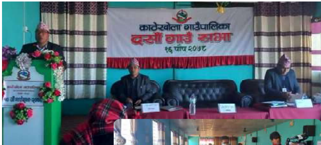
जननिगरानी संवाददाता बागलुङ

बागलुङको काठेखोला गाउँपालिकाको दशौं गाउँसभा विभिन्न प्रस्तावहरु पारित गर्दै सम्पन्न भएको छ । हिउँदे अधिवेशनका रुमा लिईने गाउँसभा प्रतिवेदन र