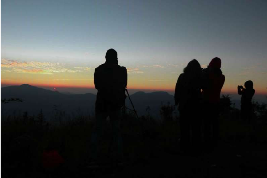
बागलुङ जिल्लाको जैमिनी नगरपालिका वडा नम्बर १० राङखानीस्थित पर्यटकीय लेक हाँडीकोटबाट सूर्योदय अवलोकन गर्दै आन्तरिक पर्यटकहरू । दुई हजार १५५ मिटर उचाइमा अवस्थित हाँडीकोटमा सूर्योदय अवलोकनको लागि आन्तरिक पर्यटकहरूको चहलपहल हुन थालेपछि स्थानीय पालिकाले पर्यटकीय पूर्वाधार निर्माण गर्न थालेको छ ।

वर्ष ५, अंक २७, पौष १८ गते आइतबार २०७८, 2 January Sunday 2021 नेपाल सम्वत १९४२, पृष्ठ ६ मूल्य रू. ८-