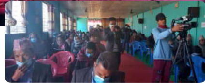
प्रस्तावहरुमा छलफल गर्दै शुक्रवार सकिएको हो ।

बागलुङको काठेखोला गाउँपालिकाको दशौं गाउँसभा विभिन्न प्रस्तावहरु पारित गर्दै सम्पन्न भएको छ । हिउँदे अधिवेशनका रुमा लिईने गाउँसभा प्रतिवेदन र