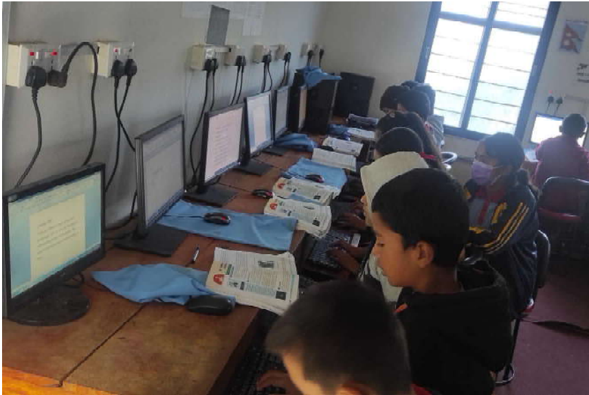
काठेखोला गाउँपालिका वडा नम्बर ७ रेशको रेश लुन्थला माध्यमिक विद्यालयको कम्प्युटर ल्याबमा कम्प्युटर सिक्दै गरेका विद्यार्थीहरू ।