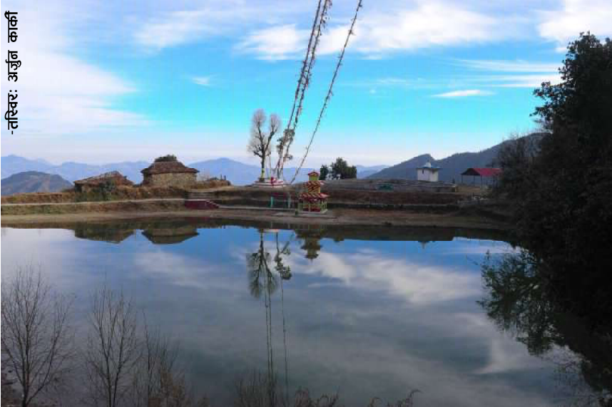
बागलुङ जिल्लाको जैमिनी नगरपालिका वडा नम्बर ३ दग्नेकस्थित गाजा दह । पर्यटकीय र सांस्कृतिक महत्व बोकेको दह गन्तव्यस्थलको रूपमा विकास भइरहेको छ ।