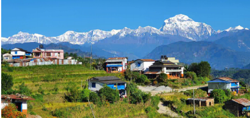
बागलुङ नगरपालिका वडा नम्बर ६ भान्सा सिमबाट देखिएको सुन्दर धौलागिरी हिमश्रृंखला ।